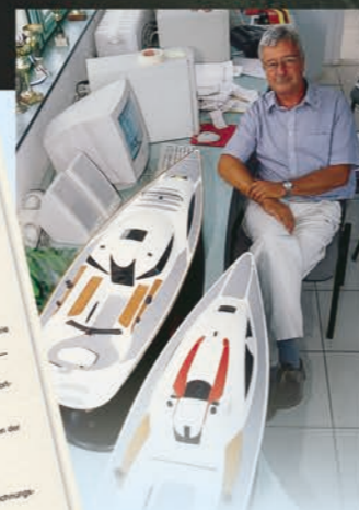
Beim Planen / Tervezés közben