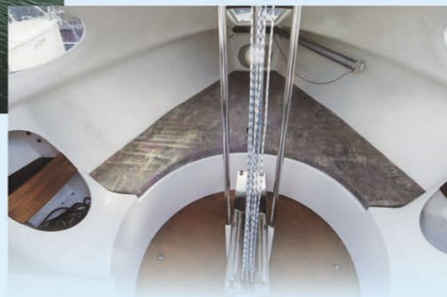
Innenraum von Racing / Racing belső