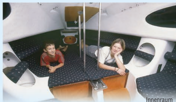
Innenraum von Touring / Touring belső