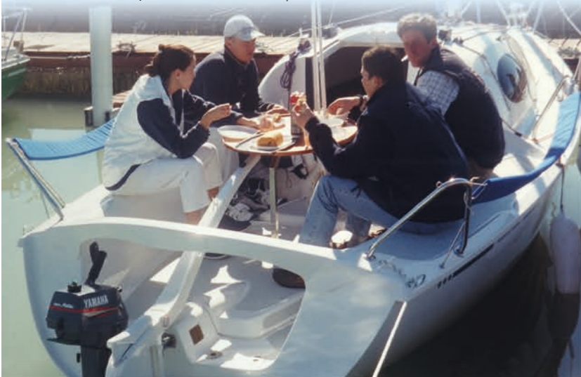
Frühstück im Cockpit / Breakfast in the cockpit