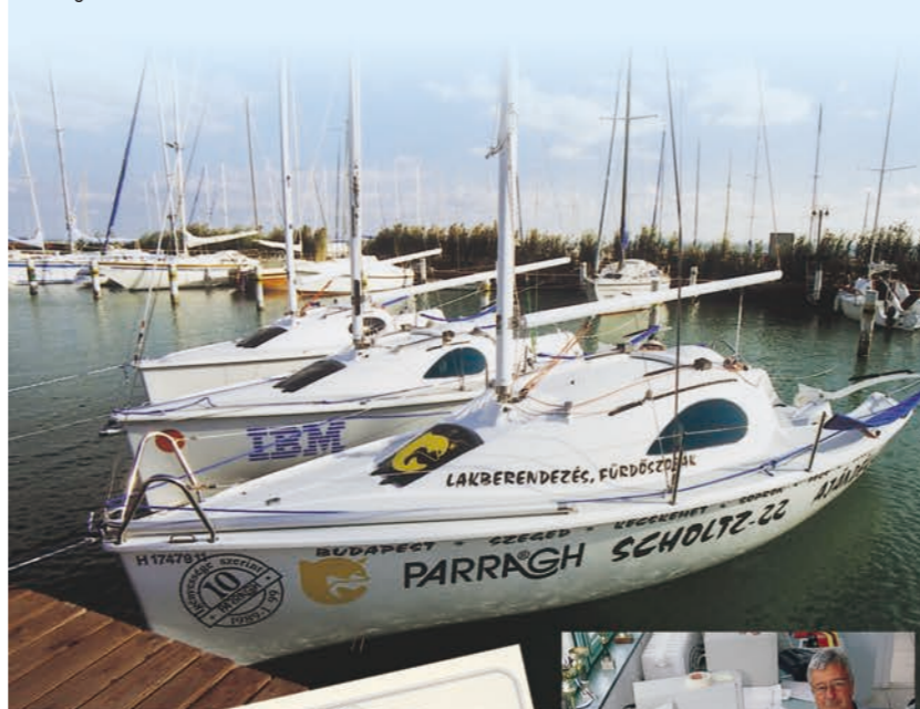
Segelboote Scholtz 22 im Marina / Kikötő 22-ekkel

Mindhárom változat könnyen szállítható, a felhúzható tökesúlyllyal készült változat daru nélkül is vízre tehető (súlyázható). A hajó külmotorral (max. 3,5HP) vagy beépített villanymotorral szerelhető fel. Az európai normák szerint épülő (eurostandard) SCHOLTZ 22-ben úgy a kezdő, mint a versenyvitorlázó könnyen kezelhető, hűséges barátja talál.