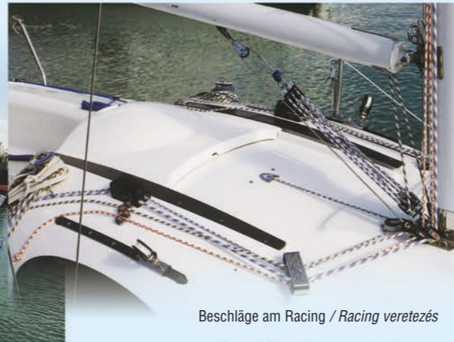
Beschläge am Racing / Racing veretezés