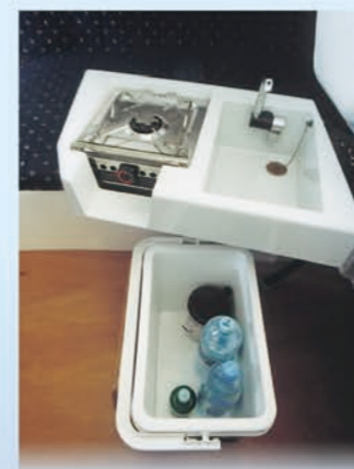
Ausziehbares Pantry in der Touring / Hűtőláda és konyha a Touring-ban.