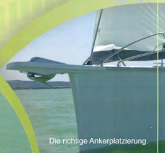
Die richtige Ankerplatzierung.